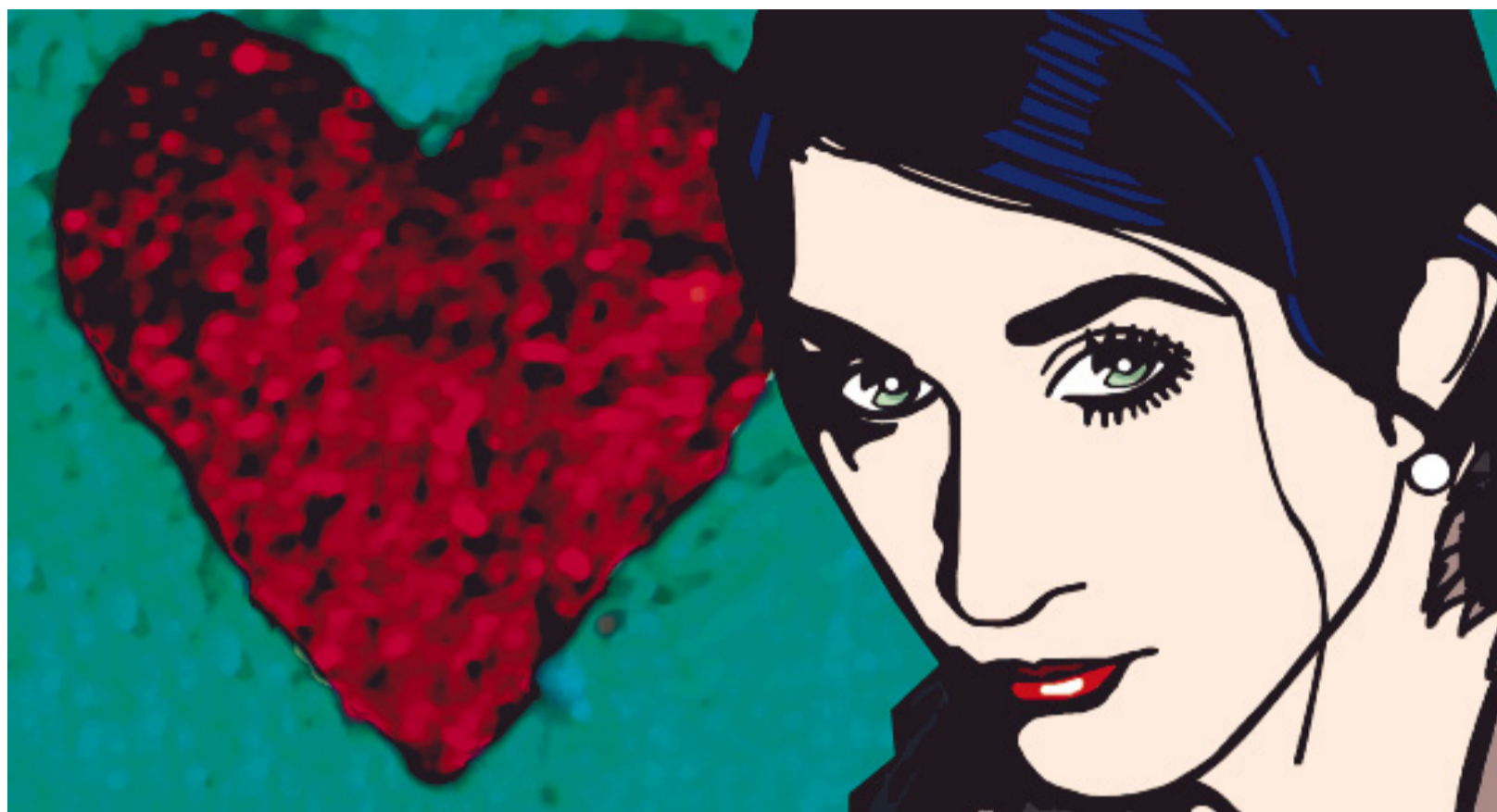
ILLUSTRATION BRIGITTA GARCIA LÓPEZ

Und gerade wer in einer gestandenen Beziehung lebt, möchte dann und wann seine Attraktivität auf dem Liebesmarkt bestätigt bekommen. «Nur weil ich im Rahmen einer Zweierbeziehung lebe, heisst das nicht, dass ich blind bin für alles ausserhalb dieses Rahmens», sagt Marc*, ein Westschweizer Fotograf. Er ist Mitte fünfzig, seit bald 30 Jahren verheiratet, Vater er-