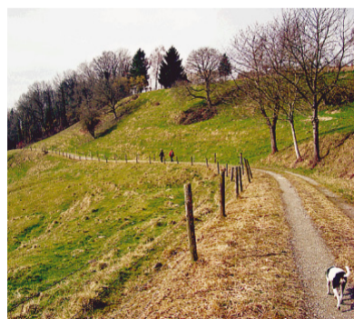
Hund Emil, Weg nach Iselisberg.