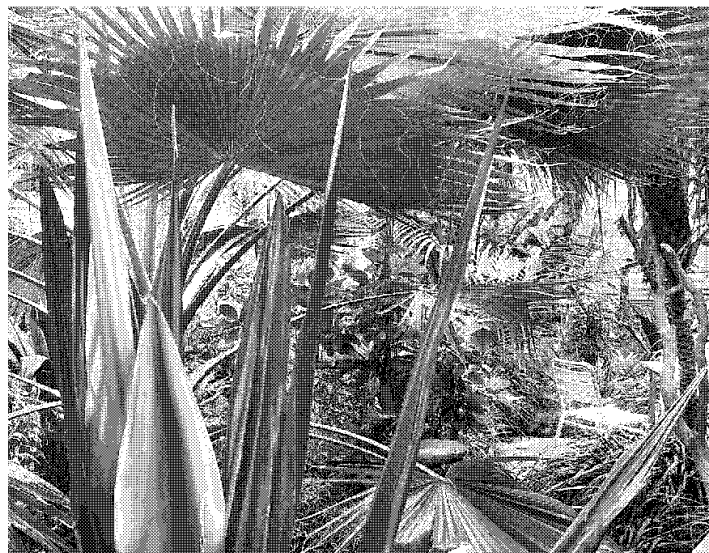
Eine Oase mitten im Irrsinn: Die Schauhäuser der Stadtgärtnerei.

Fühlen Sie sich in den Fängen eines totalitären Systems, genannt Fussballokratie?